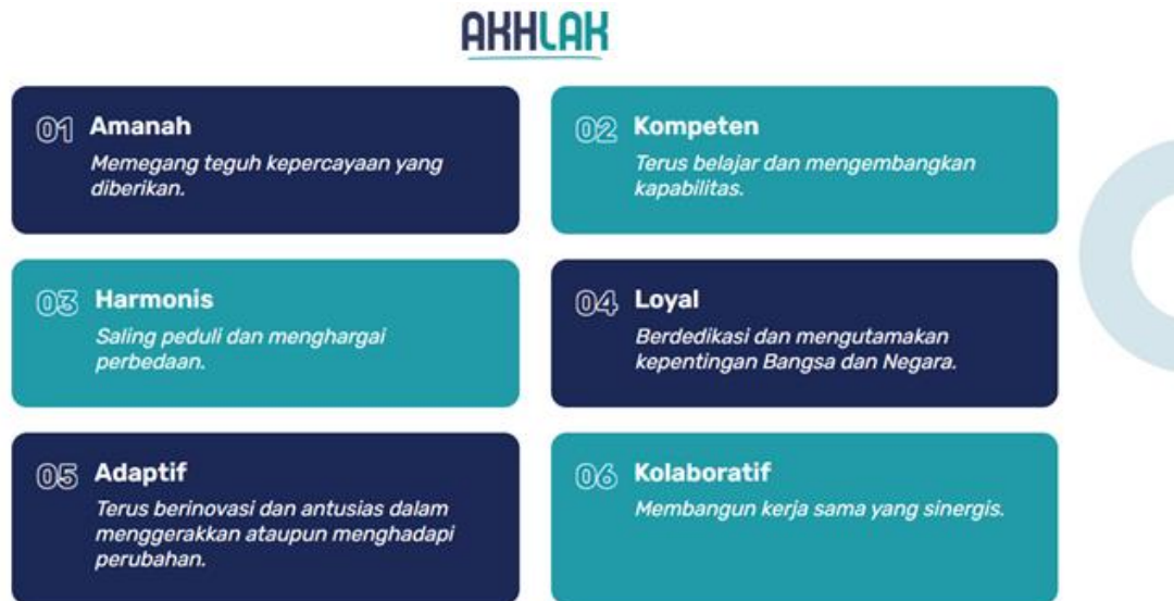
Gambar 3. Core Value ASN BerAKHLAK

Pada tanggal 27 Juli 2021, Presiden Joko Widodo resmi meluncurkan core value Aparatur Sipil Negara (ASN) yaitu BerAKHLAK. Nilai-nilai inti BEAKHLAK berada di balik perbedaan penjabaran nilai-nilai inti, serta Kode Etik dan Kode Etik ASN, sebagaimana tertuang dalam Undang-Undang Alat Perdata Negara No. 5/2014. Oleh karena itu, Kemenpan RB telah menetapkan nilai inti baru untuk menciptakan persepsi yang sama dengan nilai inti ASN. Nilai inti moralitas juga merupakan peleburan dan penyempitan nilai-nilai ASN yang ada di berbagai instansi pemerintah.