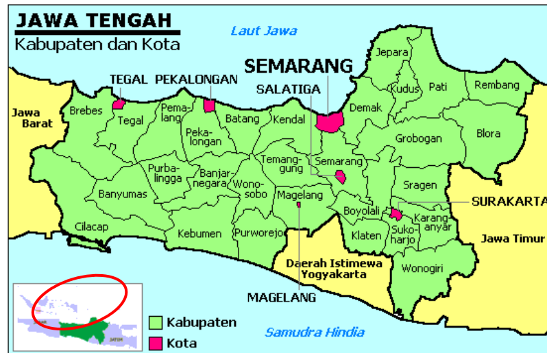
Gambar 2. Peta Provinsi Jawa Tengah

Peraturan Badan POM Nomor 29 Tahun 2019 tentang Perubahan atas Peraturan Badan POM Nomor 12 Tahun 2018 tentang Unit Pelaksana Teknis di Lingkungan Badan Pengawas Obat dan Makanan menjadi dasar pembentukan UPT di Kabupaten/Kota atau dikenal sebagai Loka POM.